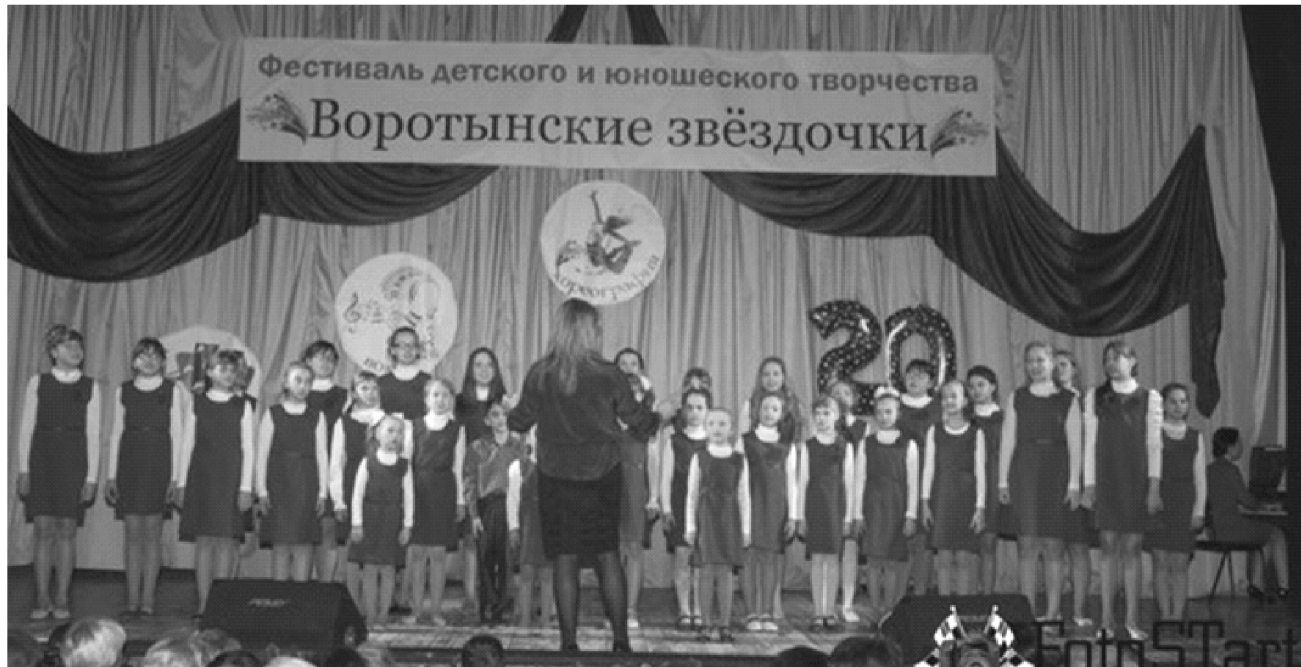
Хор Воротынской ДШИ.